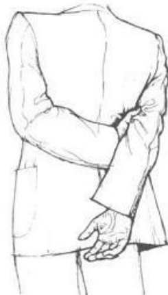
The upper arm grip